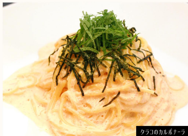
タラコのカルボナーラ