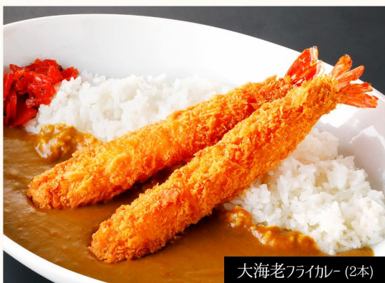
大海老フライカレー(2本)