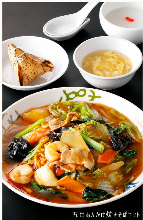
五目あんかけ焼きそばセット