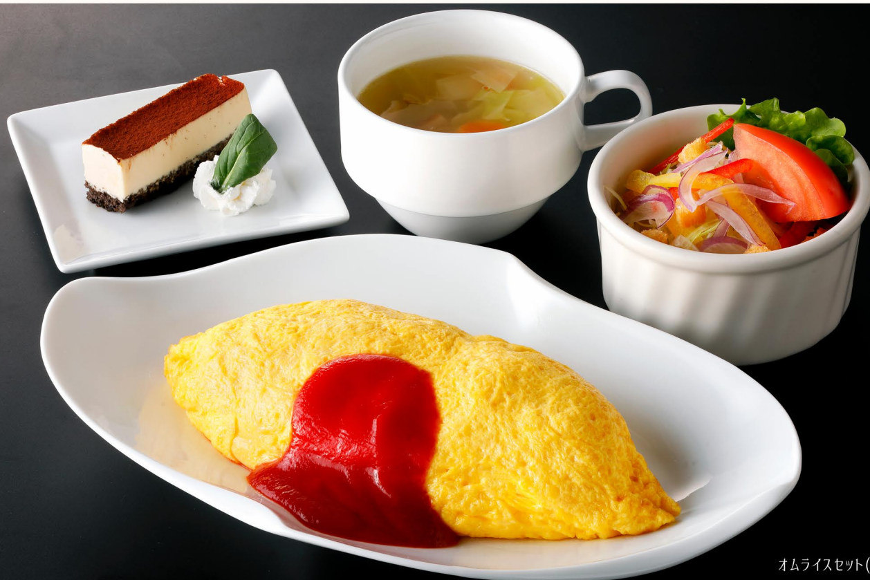
オムライスセット(トマトケチャップ)