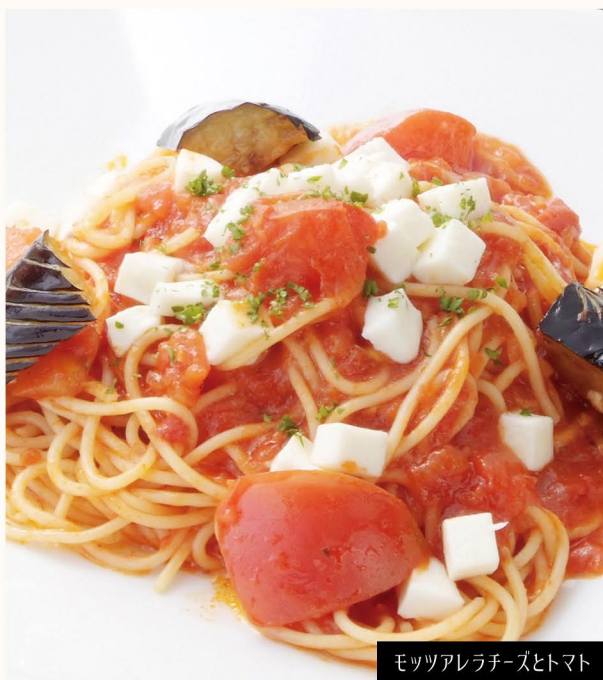
モッツアレラチーズとトマト