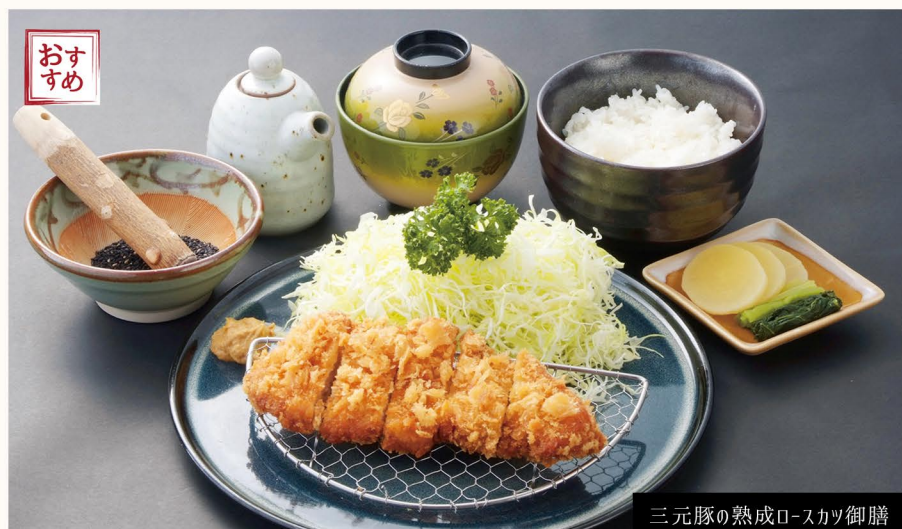
三元豚の熟成ロースカツ御膳