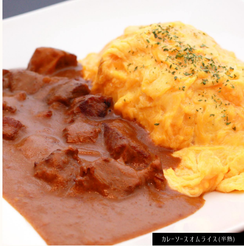
カレーソースオムライス(半熟)