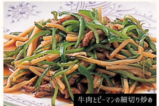
牛肉とピーマンの細切り炒め