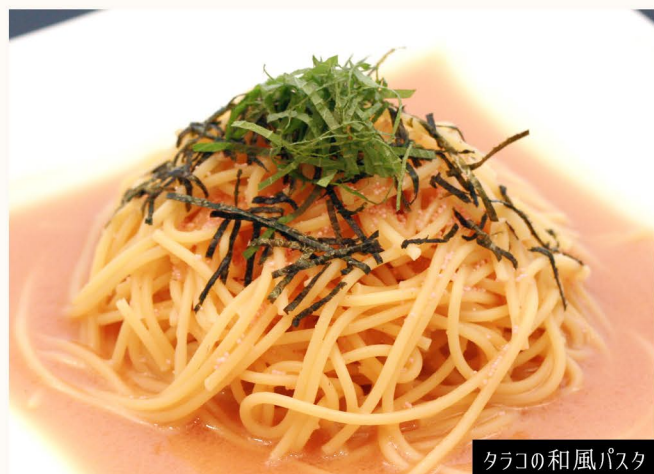
タラコの和風パスタ