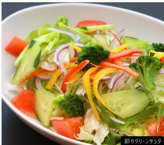
彩りグリーンサラダ