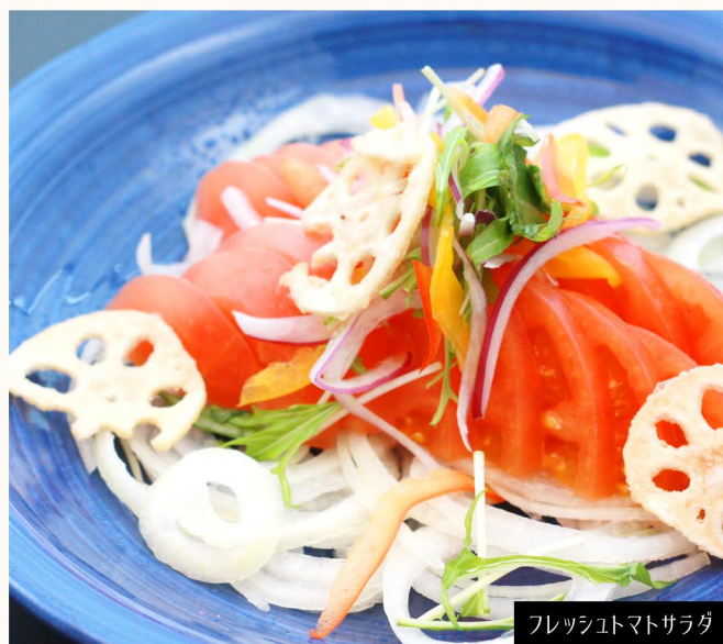
フレッシュトマトサラダ