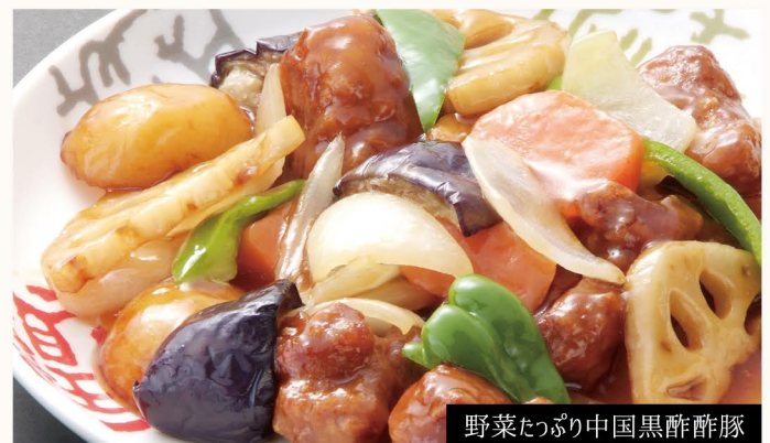
野菜たっぷり中国黒酢酢豚