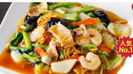
盛り付け例 人気 No.1 五目 あんかけ焼きそば 1,080円

※当店内価格とは価格帯が異なります。※メニューはすべてテイクアウトの容器でのお渡しとなります。※テイクアウトはレギュラーサイズのみ提供となります。