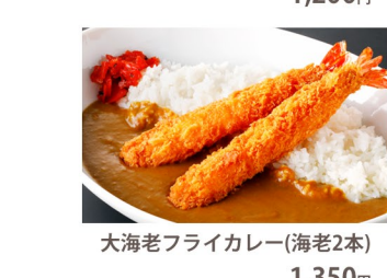
大海老フライカレー(海老2本) 1,350円