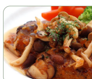
オススメ ハンバーグ きのこの 和風ソース (ライス付) 1,250円