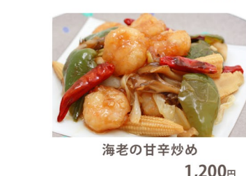
海老の甘辛炒め 1,200円